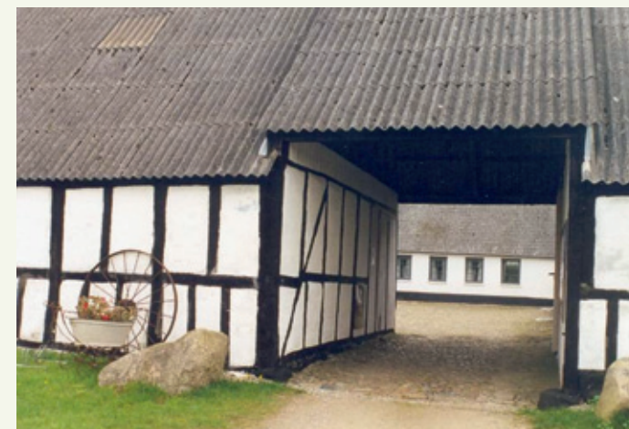
Indgang til Stjernholm

Åbent i sommersæsonen 30. april til 1.oktober Onsdage og søndage 13-16 samt efter aftale