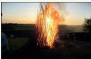
Sæsonåbning med Valborgblus