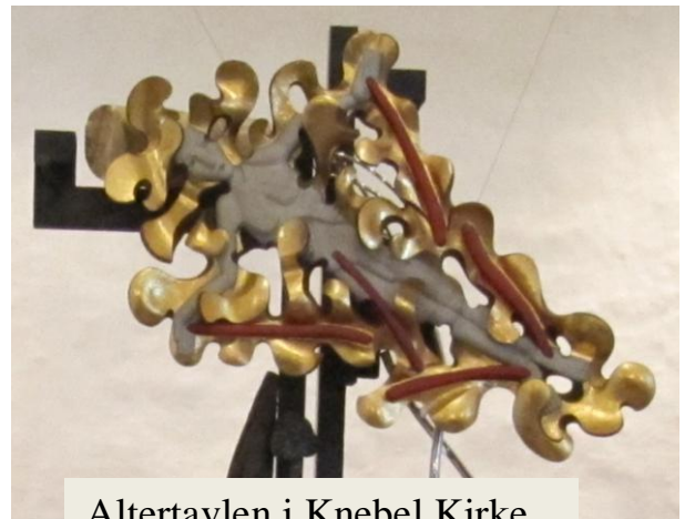
Altertavlen i Knebel Kirke