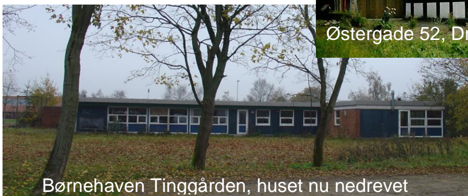
Børnehaven Tinggården, huset nu nedrevet