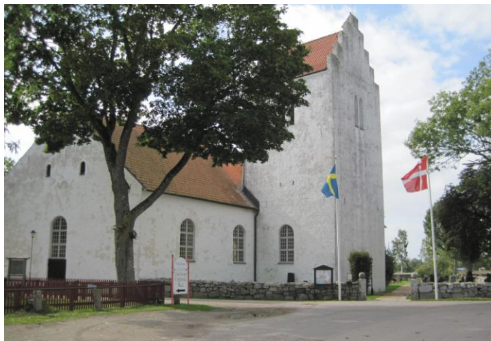
Fæstningsbyen Kristianopel i Blekinge blev grundlagt år 1600 af Christian IV og havde en omtumlet skæbne i første halvdel af 1600-tallet. – Her flages med både det danske og det svenske flag ved Treenighedskirken.

Jeg har selv for nylig været på en rejse, der i høj grad var inspireret af en slægts historie – ikke min egen – men min datters fædrene slægt, som jeg for mange, mange år siden forskede meget i, og da sporene på et tidspunkt bevægede sig ind i en nordjysk adelsslægt, var det rimelig nemt at læse sig til meget på Landsarkivet og Rigsarkivet, og dengang fik jeg for alvor styrket min historiske interesse.