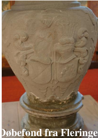
Døbefond fra Fleringe

Rigtig mange af os kan være heldige at ”ramle” ind i en adelsslægt, hvor der i forvejen findes en masse skriftlig dokumentation, og når man så kan se de steder, de har levet og følge de spor, de har sat for dem, deres samtidige og deres efterslægt – ja, så føler man virkelig historiens vingesus. Under denne rejse fik vi i tilgift så