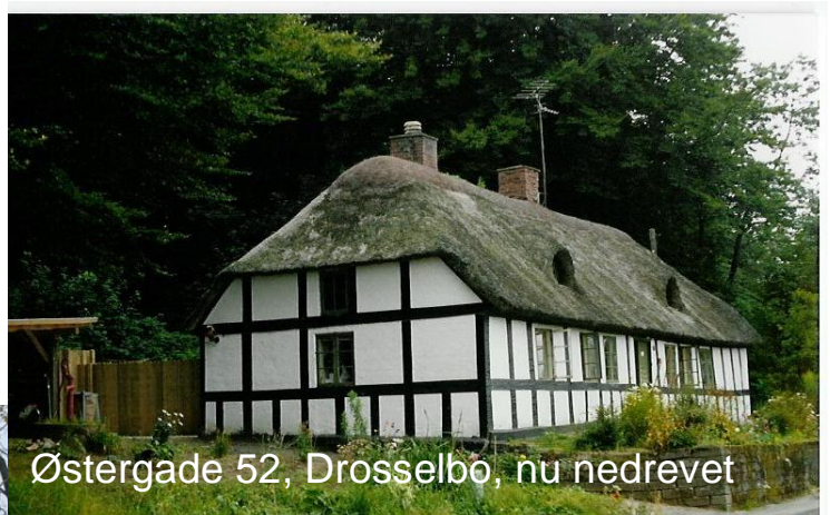
Østergade 52, Drosselbo, nu nedrevet

Vi har tidligere opfordret interesserede til at fotografere huse i byen – og dette store ønske er nu gået i opfyldelse, idet Poul Brink netop har indleveret en stor samling nye og nyere billeder af byen, ikke blot som den ser ud i dag, men også med en del gamle fotos til sammenligning.